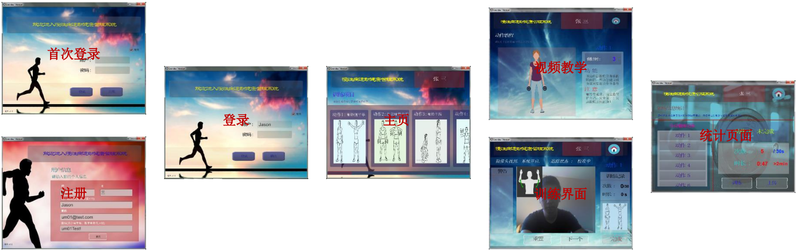
当前版本包含的锻炼项目: (20 个)